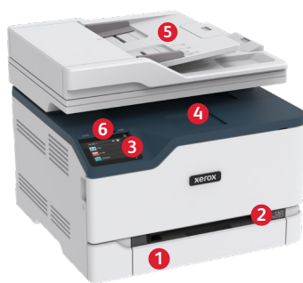
Xerox® C235 Multifunktions-Farbdrucker