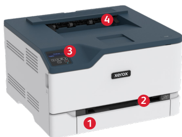
Xerox® C230 Farbdrucker